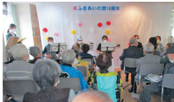
◀ふきあいの郷10周年の様子

柳筋診療所は、神戸市中央区 旗塚通にある「ふきあいの郷」 の2階にあります。「ふきあいの 郷」には、3・4階にサービ ス付き高齢者住宅「ケアホーム 布引」、2階には柳筋診療所の ほかに訪問看護ステーション 「こすもす」、ヘルパーステー ション「あす」、居宅介護事 業所「ケアプランセンターわか ば」、1階には「デイサービスや なしん」があり、医療と介護を 一体的に提供できる施設です。 医療と介護の複合施設「ふきあ いの郷」は、2011年まで神 若通にあった柳筋診療所が今の 地に移った時に誕生しました。