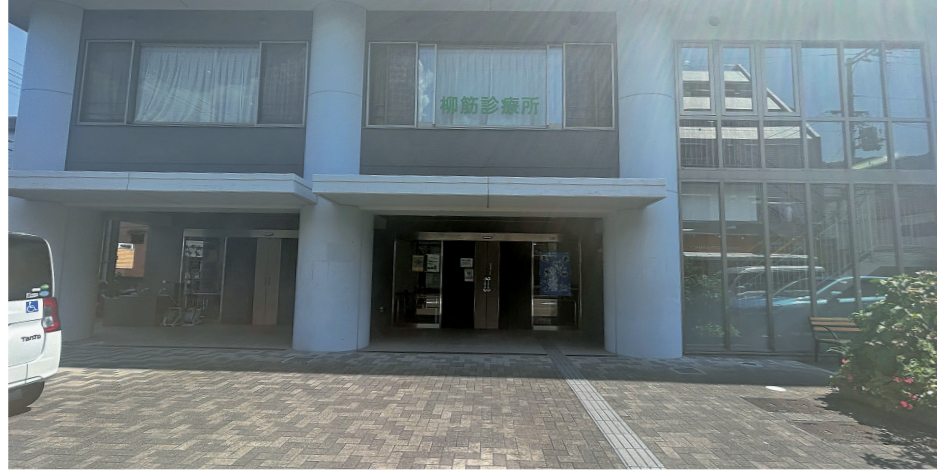
▲現在の柳筋診療所