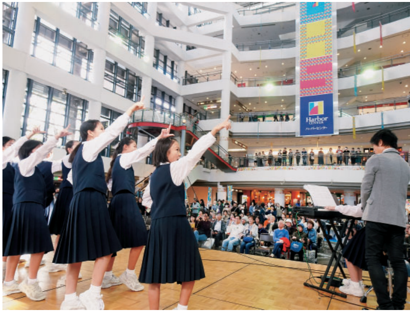
2019年「健康まつり」のステージの様子

域の方をお誘いしてぜひ参加ください！みなさんの参加を心よりお待ち申し上げます。 『健康まつり』は11月5日(日)にスペースシアターで開催します。1部では神戸健康共和国とともに70周年の記念式典をおこない、2部が健