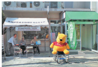
▲以前の柳筋診療所

今号「健康ニュース」に右記のチラシを折り込んでお ります。医療機器などの設備の更新や事業所の開設、建 て替えには組合員のみなさんからの出資金が大きな力と なっております。医療・介護を誰もが安心して受け続け られるためにみなさんの出資金で応援をお願いします。