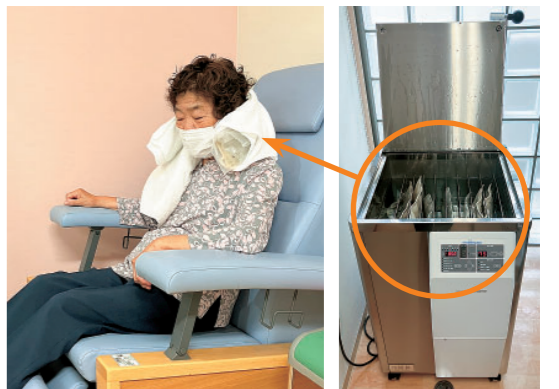
※「ホットパック」は機械で温め、首や肩などにタオルで巻いて患部にゆっくりと当てて、痛みや緊張を和らげるための医療機器です。

療所では購入するかどうかを慎重に検討していました。そんな中、使用していた患者さんから「ホットパックが欲しい」、「また世間話がしたい」という声が聞こえてきました。それで、早速購入するわけにはい